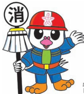
広島市消防団マスコットキャラクター「ひろビー」